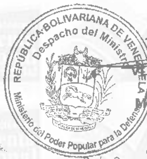
DIMIR PADRINO LÓPEZ General en Jefe Ministro del Poder Popular para la Defensa