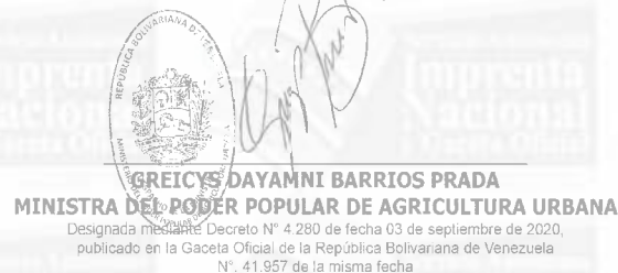
GREICYS DAYAMNI BARRIOS PRADA MINISTRA DEL PODER POPULAR DE AGRICULTURA URBANA Designada mediante Decreto N° 4.280 de fecha 03 de septiembre de 2020, publicado en la Gaceta Oficial de la República Bolivariana de Venezuela N°. 41.957 de la misma fecha

Comuníquese y Publíquese. Por el Ejecutivo Nacional,