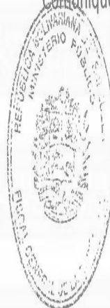
TAREK WILLIANS SAAB Fiscal General de la República