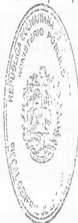
TAREK WILLIANS SAAB Fiscal General de la República