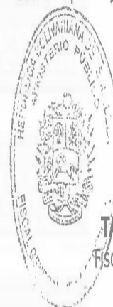
TAREK WILLIANS SAAB Fiscal General de la República